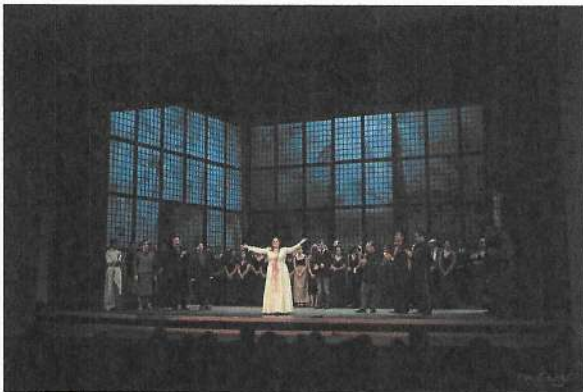
Lucia di Lammermoor